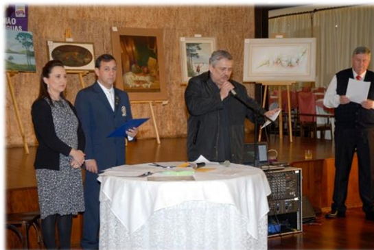
Primeiro evento realizado pela Casa de Apoio. Leilão de telas doados por artistas locais