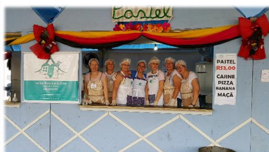
Participação da Festa do Steinhaeger e do Xixo, com a venda de Pastéis, feitos pelo Grupo de Voluntárias.