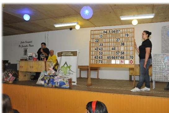
Realização de bingos.